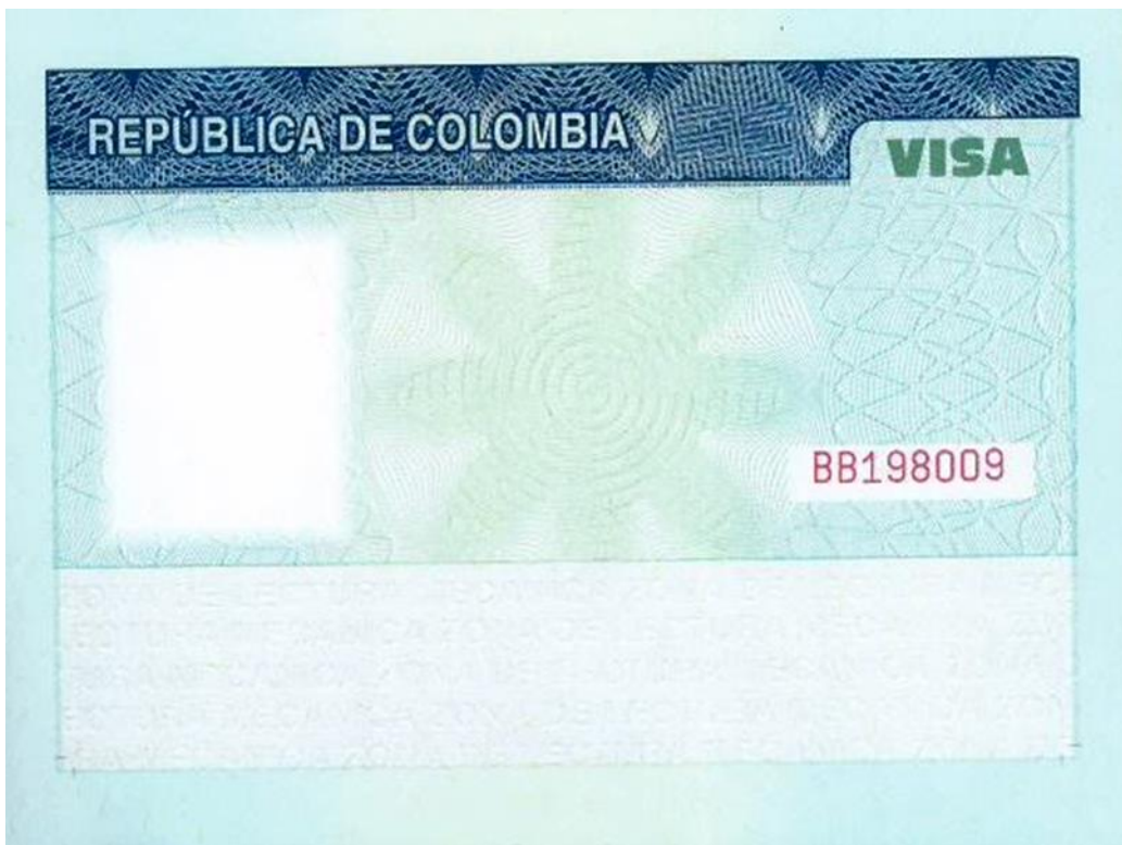
Diagrama No. 04 – FORMATO DE ETIQUETA ACTUAL DE COLOMBIA