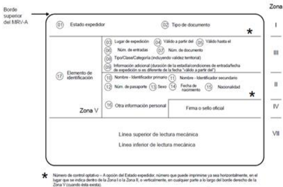
Diagrama No. 03 – DISPOSICION NOMINAL DE LAS ZONAS EN UN MRV-A