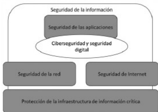
Figura 2. Modelo de Seguridad y Privacidad de la Información

La infraestructura de datos del Estado está soportada por procesos tecnológicos, normativos y de políticas que se debe garantizar la seguridad digital y privacidad de los datos. Estos dos componentes son esenciales en el desarrollo y gestión de la infraestructura de los datos, y a su vez, se derivan en seguridad de la información, seguridad de las aplicaciones, ciberseguridad y seguridad digital, seguridad de la red, seguridad de Internet y protección de infraestructura crítica.