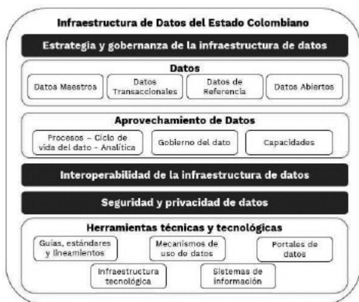
Figura 1. Marco de entendimiento de la Infraestructura de Datos del Estado colombiano

En la Figura 1, expuesta a continuación, se muestran los componentes de la infraestructura de datos del Estado colombiano. El primer componente – La Estrategia y gobernanza de la infraestructura de datos del Estado, es la sombrilla de la infraestructura de datos, a través de ésta se definen las estrategias, políticas, normativas, lineamientos y estándares que permiten la gestión y aprovechamiento de los datos de la infraestructura. El segundo componente – los Datos, se constituyen en el activo central y más importante de la infraestructura de datos del Estado colombiano. El tercer componente - Aprovechamiento de la infraestructura de datos, es el objetivo de la gestión e implementación de la infraestructura; para el desarrollo de este componente es necesario el ciclo de vida de los datos, y las capacidades de los actores que integran la infraestructura de datos para generar valor de estos. El cuarto y quinto componente - Interoperabilidad de la infraestructura de datos y la Seguridad de los datos, son los elementos estructurales para el desarrollo y mantenimiento de la infraestructura de datos. Por último, el sexto componente - Insumos técnicos y tecnológicos, son los instrumentos que facilitan el aprovechamiento de la infraestructura por parte de los distintos actores.