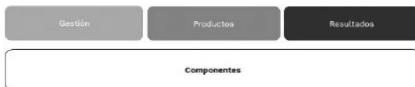
Figura 4. Esquema de medición de la infraestructura de datos del Estado

Por tanto, se establece una cadena de transformación (Ver Figura 4) donde el proceso se compone de ejercicios de gestión, requeridos para el desarrollo de los componentes de la infraestructura de datos. La transformación de la gestión en productos (bienes o servicios) requiere de actividades, es decir acciones y procedimientos.