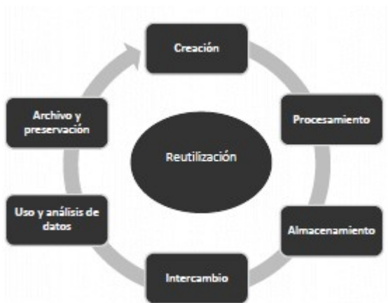
Figura 1. Fases del ciclo de vida del dato

La gestión del ciclo de vida del dato es un proceso indispensable para alcanzar el aprovechamiento dispuestos en la infraestructura de datos del Estado. El ciclo de vida de los datos está integrado por fases como se muestra en la figura 1.