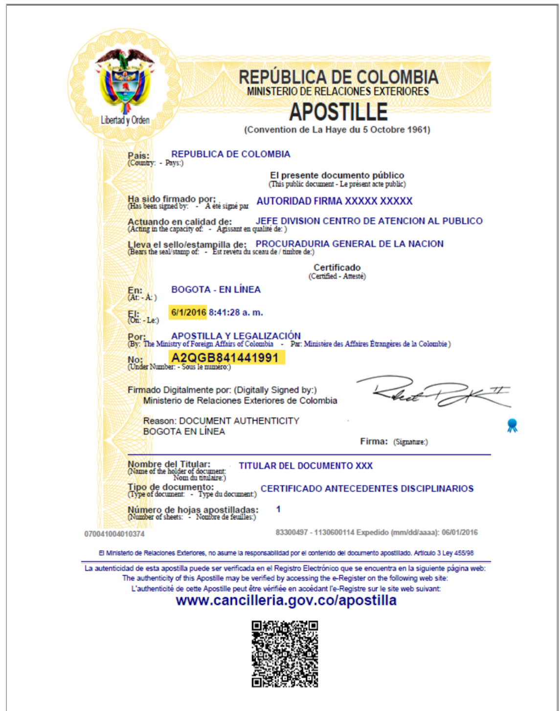
Imagen CD2 Documento apostillado