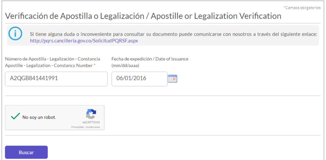
Imagen CD1 Formulario de Consulta de Documento