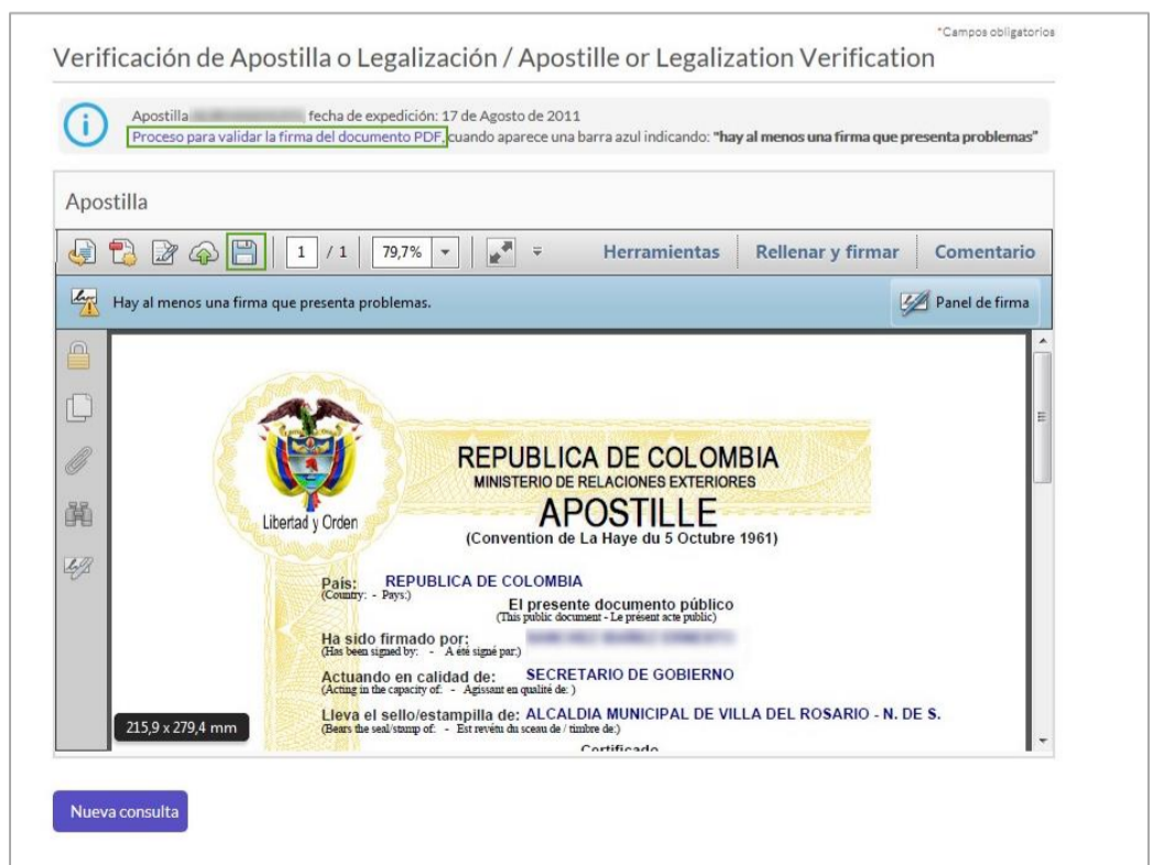
Imagen CD4 Descarga y validación de firma