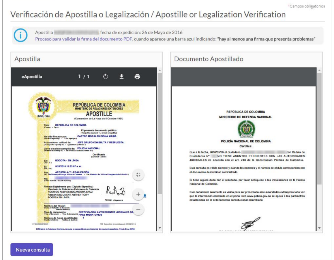
Imagen CD3 Resultado de Búsqueda