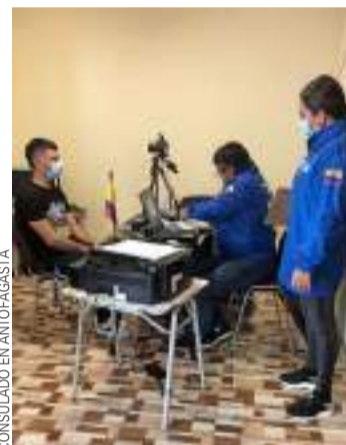
El Consulado en Antofagasta atiende alrededor de 1.000 personas al mes.

Colombia, como Estado social de derecho pluralista, tiene la misión de preservar la diversidad étnica y la riqueza de las culturas que componen la nación colombiana. Bajo esa óptica, para