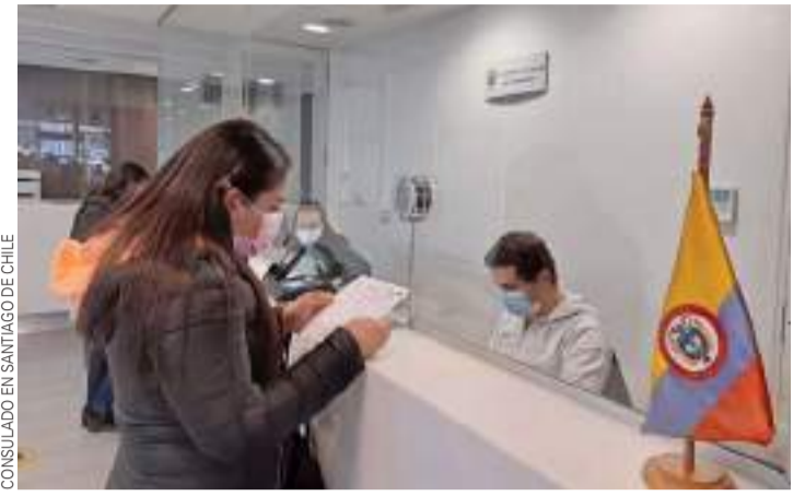
En el Consulado de Santiago se han efectuado 16.308 trámites entre enero y junio.

Para atender la alta demanda, las oficinas consulares de Santiago y Antofagasta han doblado sus esfuerzos para que se puedan realizar trámites en línea y presenciales, respetando las medidas sanitarias.