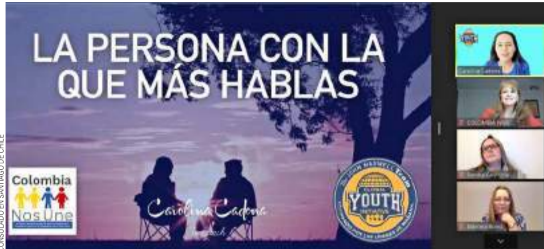
Las actividades en el marco de "Colombia nos une" se están realizando ahora de manera virtual.

Esta es una realidad que es transversal a todas las instituciones con atención al público, y debido a su responsabilidad de ofrecer trámites esenciales, el Consulado de Colombia en Santiago implementó el sistema de agendamiento de citas de Cancillería para aquellos trámites que así lo requieren.