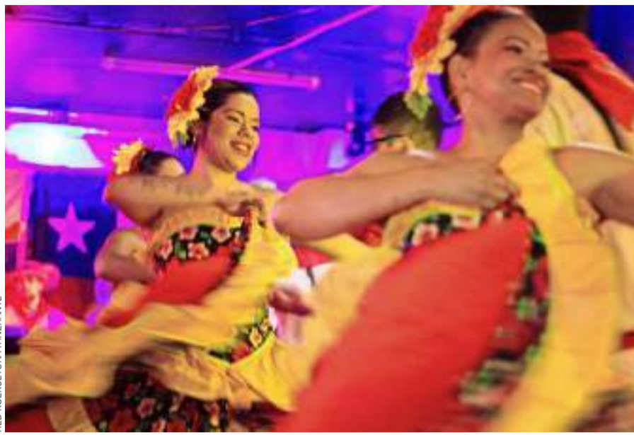
Red KolKultura Itinerante difunde la cultura y el arte.

Finalmente, la Fundación Damas Colombianas (FDC) se ha posicionado como una red que beneficia a los migrantes, especialmente a los colombianos, en su proceso de inserción en Chile para que contribuyan a la construcción de una mejor sociedad. Desde 2020, FDC ha logrado cubrir las necesidades básicas de más de 1.300 familias migrantes, ha patrocinado el desarrollo de diversos programas en la Escuela República de Colombia, entregado asesoría y aportes para la regularización de migrantes vulnerables, ha capacitado emprendedores en habilidades básicas y la mejora de sus capacidades tecnológicas, y llevado a cabo ferias virtuales de emprendimiento.