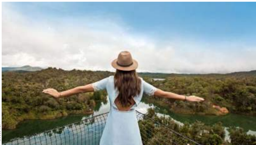
En los Andes Occidentales, uno de los departamentos protagonistas es Antioquia.

nuevas tendencias del sector. La estrategia consiste principalmente en agrupar la oferta turística en seis grandes macro regiones, identificadas como Gran Caribe, Pacífico, Los Andes Occidentales, Los Andes Orientales, El Macizo y La Amazonía-Orinoquía. Esto con el fin de presentar una oferta más organizada, más sostenible y competitiva. Cada una de ellas cuenta con al menos un atractivo de talla mundial y satisface segmentos diferentes de turismo que corresponden a nichos concretos de viajeros.