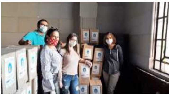
Fundación Red Migrantes ha implementado diferentes iniciativas como la entrega de alimentos.

En el norte de Chile se encuentra la Agrupación de Colombianos Migrantes Unidos en Arica-Chile, cuyo principal objetivo es unir a los colombianos radicados en esta zona del país. La agrupación, que cuenta con más de once años, apoya a personas que enfrentan situaciones difíciles, logrando, por ejemplo, la organización de un comedor comunitario para personas en situación de calle y la entrega de