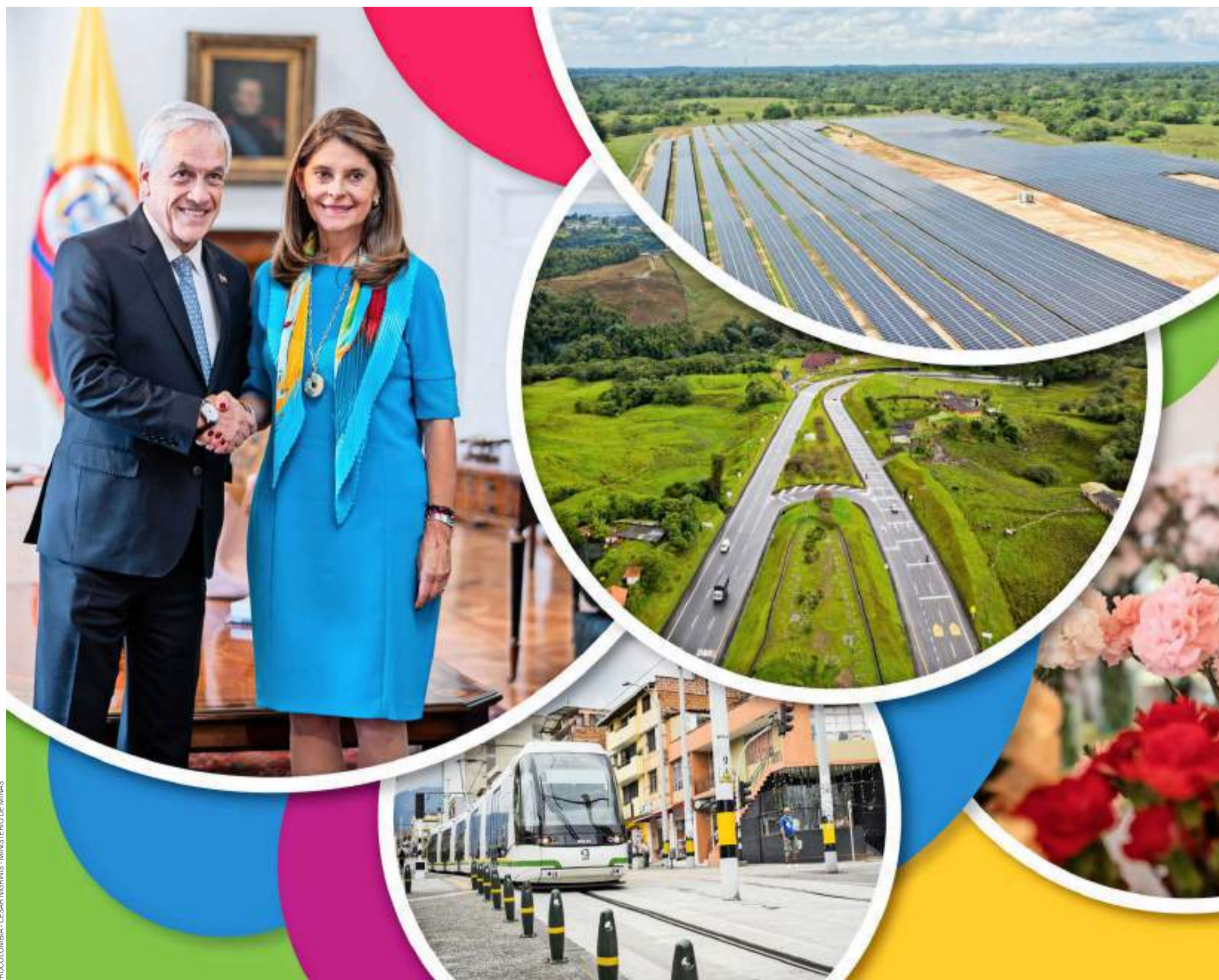
Colombia tiene grandes recursos naturales y enormes opciones comerciales, potenciadas por un sector privado pujante y una población activa y competente.