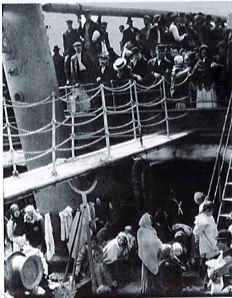
PASAJEROS DE TERCERA -1911, FOTOGRAFÍA TOMADA DURANTE UN VIAJE TRANSATLÁNTICO POR ALFRED STIEGLITZ (LIBRO "TÉCNICAS DE LOS GRANDES FOTOGRAFOS")

El 8 de septiembre de 1879, en desafortunados hechos ocurridos en la ciudad de Bucaramanga, perdieron la vida varios súbditos alemanes y otros tantos fueron heridos. Ante los reclamos de Alemania, el Secretario de Relaciones Exteriores de Colombia, doctor Rico, dio cuenta de las medidas tomadas para la captura y posterior juicio de los implicados, los que deberían ser juzgados por las leyes del Estado Soberano del Santander, reconociendo las indemnizaciones que correspondieran. No obstante, el impase no fue de rápida solución, sólo hasta el 7 de junio de 1884, se halló