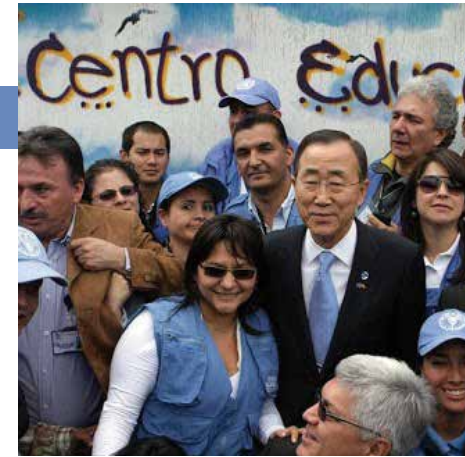
Secretario de la ONU Ban Ki-moon promulgación de la Ley de Víctimas. Bogotá, junio 2011.

El respeto a los Derechos Humanos es un elemento esencial del Acuerdo. Por lo tanto, las Partes deben asegurar que se cumplirán los principios democráticos y los Derechos Humanos reconocidos internacionalmente. Las violaciones a la cláusula que se refiere al respeto de los Derechos Humanos en el Acuerdo da el derecho a la otra Parte a adoptar las medidas necesarias de acuerdo a la ley internacional.