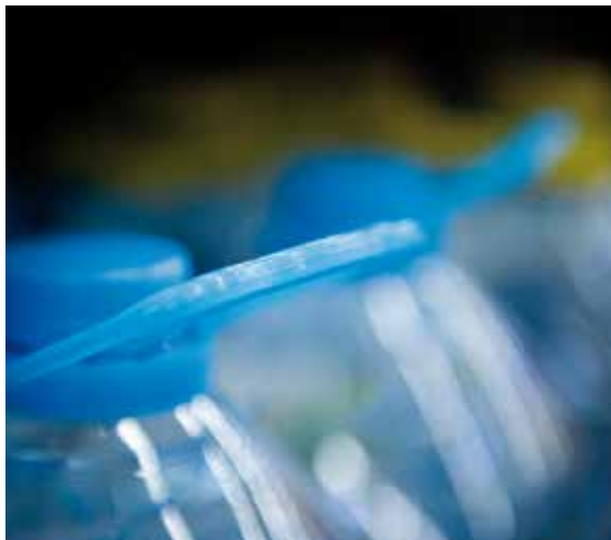
PETROQUÍMICA Y PLÁSTICOS

Petroquímica y plásticos: con el Acuerdo se lograron medidas mucho más flexibles que las que se tenían con el anterior sistema de preferencias 2 .