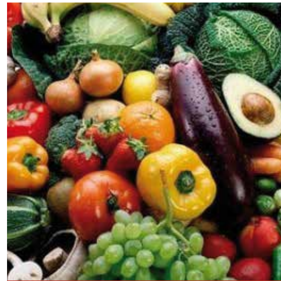
FRUTAS Y HORTALIZAS

Aceite de palma: con el Acuerdo el aceite crudo y refinado de Colombia tiene libre acceso a la Unión Europea. Adicionalmente, se lograron preferencias arancelarias para aceites vegetales, aceites animales y mezclas refinadas a partir de aceites en bruto originarios.