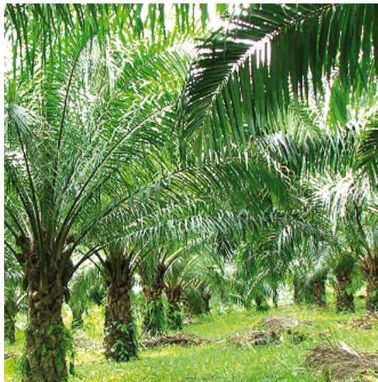
ACEITE DE PALMA

Café: Colombia logra con el Acuerdo la exención de aranceles para el café tostado y las preparaciones de café.