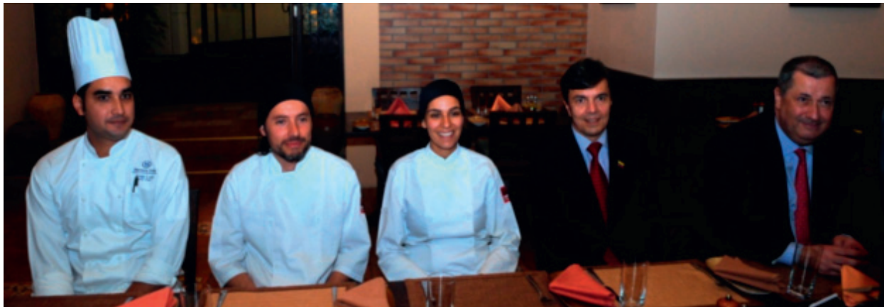
Fuente: Festival gastronómico en Doha