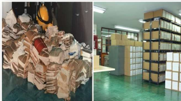
Foto del Archivo Central ubicado para la época en la carrera décima en el centro de Bogotá

2003 a 2007 Organización de los documentos bajo la custodia del Archivo Central. Se inició la implementación de las TRD y se realizaron las primeras transferencias documentales primarias. Las acciones mencionadas favorecieron la eficiencia en la consulta y el acceso a los documentos